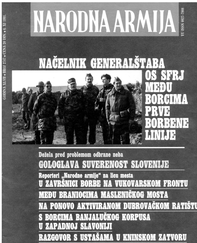
Slika ratnih zločinaca generala Blagoja Adžića (četvrti s desna) i pukovnika Veselina Šljivčanina (treći s desna), snimljena tijekom bitke za Vukovar, objavljena je početkom studenoga 1991. na naslovnici vojnog lista Narodna armija.

drije Biorčevića i Operativne grupe "Jug" pod zapovjedništvom pukovnika Mile Mrkšića, uz zračnu potporu postrojbe 1. zrakoplovnog korpusa pod zapovjedništvom pukovnika Branislava Petrovića. Sama operacija izvedena je pod zapovjedništvom generala Živote Panića, zapovjednika 1. vojne oblasti. 101 Zauzimanje grada novinari su popratili rečenicom: "Oslobodioci, jedinice JNA i TO i dobrovoljački sastavi, osvajali su kuću po kuću, čuvajući živote sopstvenih ljudi i građana, iskazujući snalažljivost u borbama u naseljenim mestima, potvrđujući humanost, ispoljavajući hrabrost" 102 , kao i da "Vukovar nije osvojen grad. To je grad oslobo-